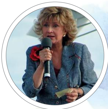
Регина Дубовицкая , телеведущая

Это было в первом классе. Вместе со мной учились девочки с совершенно необыкновенными, как мне тогда казалось, именами: Коммуна, Октябрина, Майя (в честь 1 мая). И я им очень завидовала. Причем так сильно, что за несколько дней до 8 марта сказала учительнице, будто в честь приближающегося праздника родители переименовали меня в Марту.