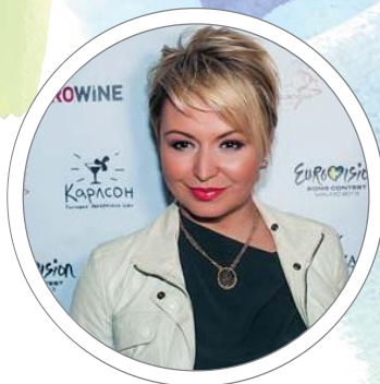
Катя Лель, певица

Из подарков, которые я когда-либо получала к 8 марта, мне запомнилась необыкновенных размеров и красоты роза. Больше таких никогда не видела. С ней связана необыкновенная история. На улице ко мне подошел незнакомый мужчина, сказал: «Это вам!» — и протянул это чудо. Я так растерялась, что, когда пришла в себя, знакомого и след простыл.